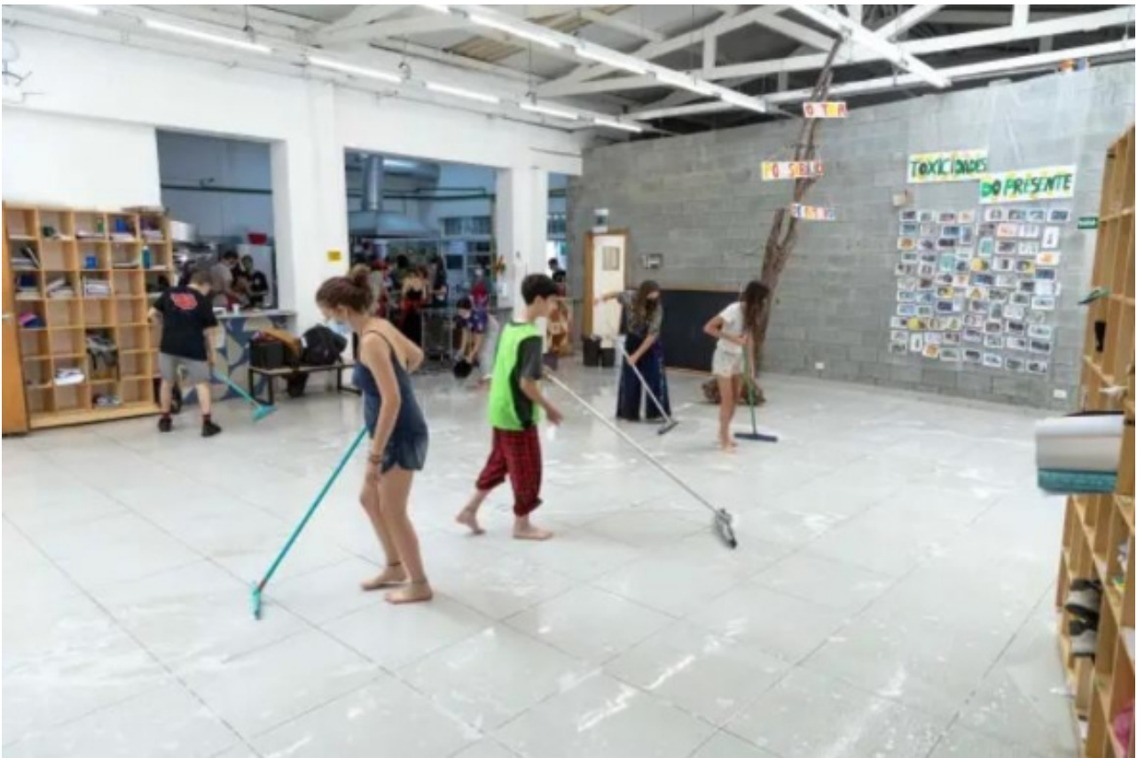
FIGURA 3- Estudantes realizando a limpeza do ambiente escolar