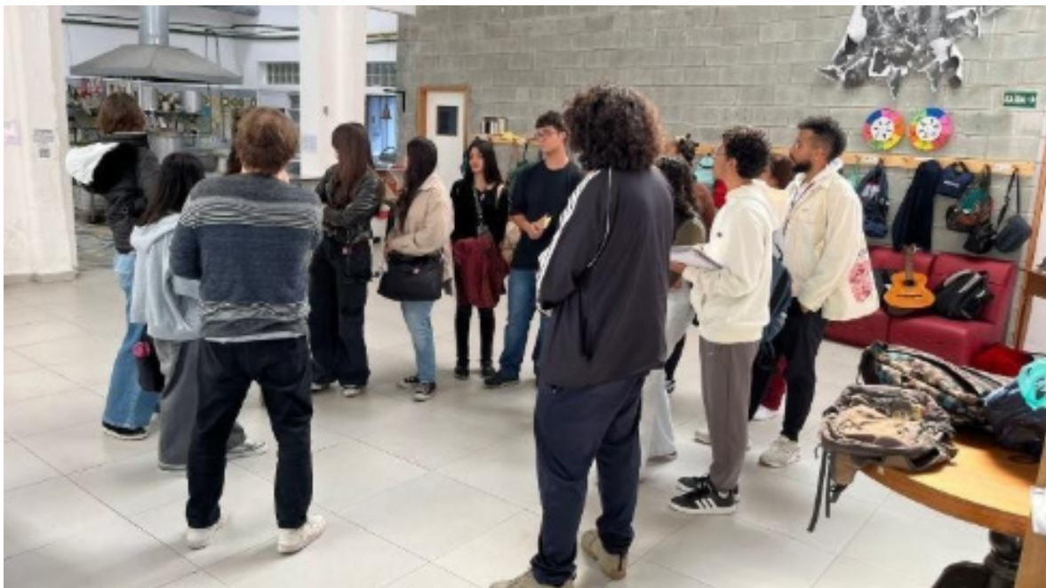
FIGURA 1- Licenciandos(as) em visita pedagógica à escola ARCO

na Unidade Curricular Democracia e Ética. A atividade foi planejada com a intenção de possibilitar que professores em formação inicial reconheçam e analisem diferentes formas de organização escolar, articulando a experiência de campo às discussões teóricas, especialmente, sobre gestão democrática.