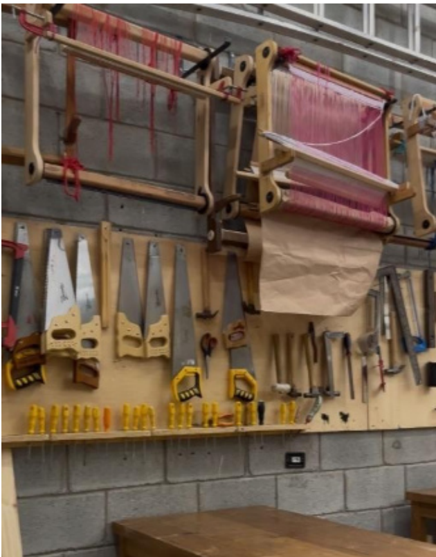
FIGURA 6 - Espaço utilizado pelos estudantes para a realização de atividades artísticas

relações próximas entre seus integrantes, nas quais a participação e o compartilhamento de responsabilidades se constituem como elementos centrais. Esses aspectos contribuem para que os estudantes se reconheçam como sujeitos ativos na construção da vida escolar.