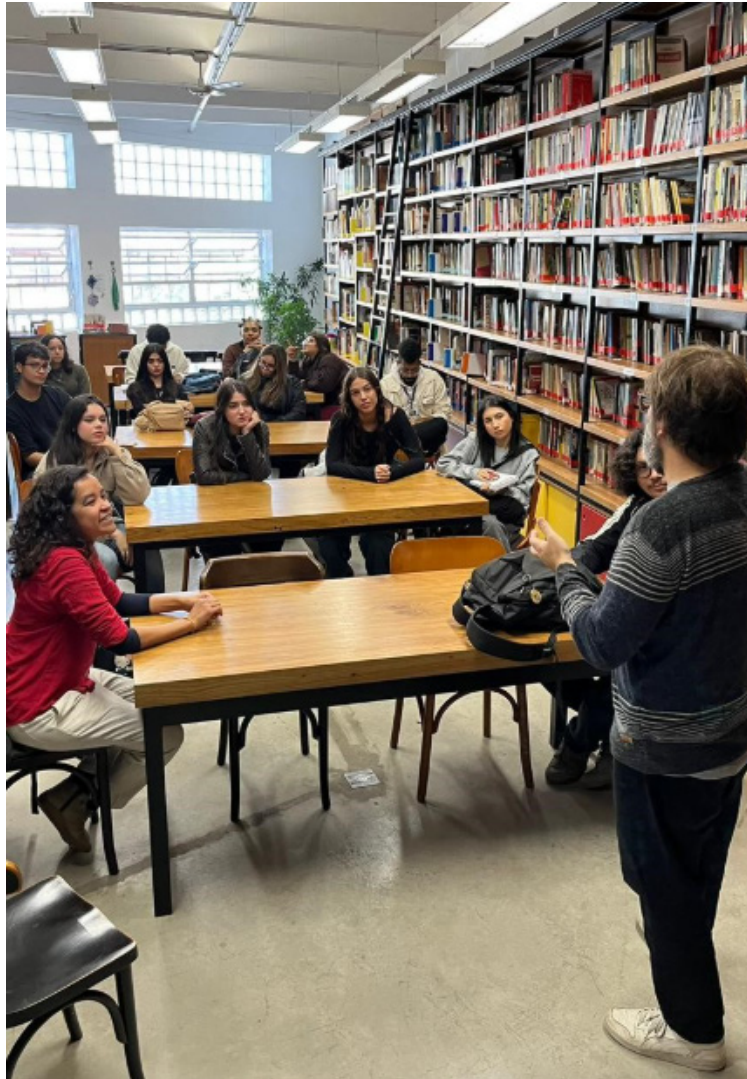
FIGURA 4- Momento de conversa com um dos professores da Escola ARCO

Os estudantes relataram que a convivência com os professores se estabelece de forma horizontal, marcada pela proximidade, pelo diálogo e pela construção conjunta do conhecimento. Essa percepção se relaciona às reflexões de Tardif (2014), que compreende o trabalho docente como uma prática construída na interação com os estudantes e com os diferentes saberes mobilizados no cotidiano escolar. Nessa perspectiva, o