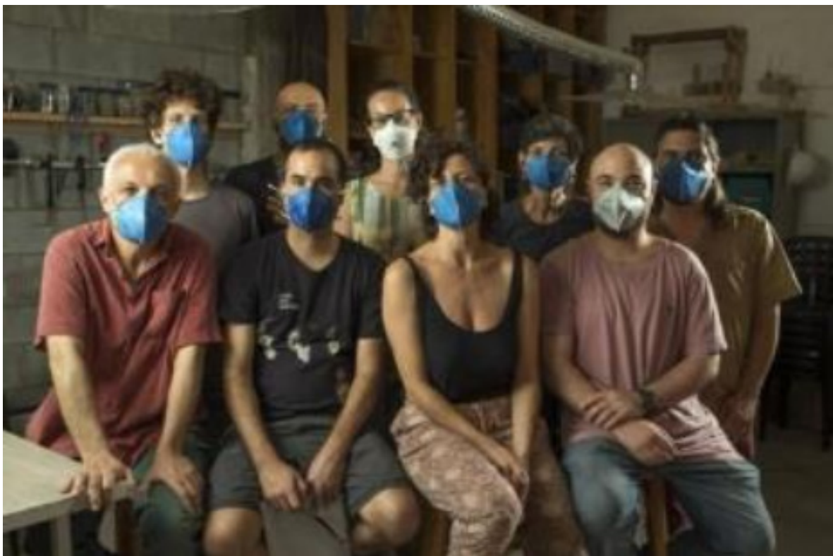
FIGURA 2- Professores da ARCO em reportagem do jornal Folha de S.Paulo

instituir a ARCO Escola-Cooperativa, voltada aos anos finais do Ensino Fundamental e ao Ensino Médio. Paralelamente, foi criado um espaço cultural denominado ARCO Educação e Cultura. O cooperativismo e os princípios de comunalidade foram mobilizados como estratégias para a construção de relações mais equitativas e solidárias no campo educacional, diante de um contexto de desvalorização profissional, marcado pela precarização do trabalho e pela restrição da autonomia docente, (ARCO ESCOLACOOOPERATIVA, s.d.).