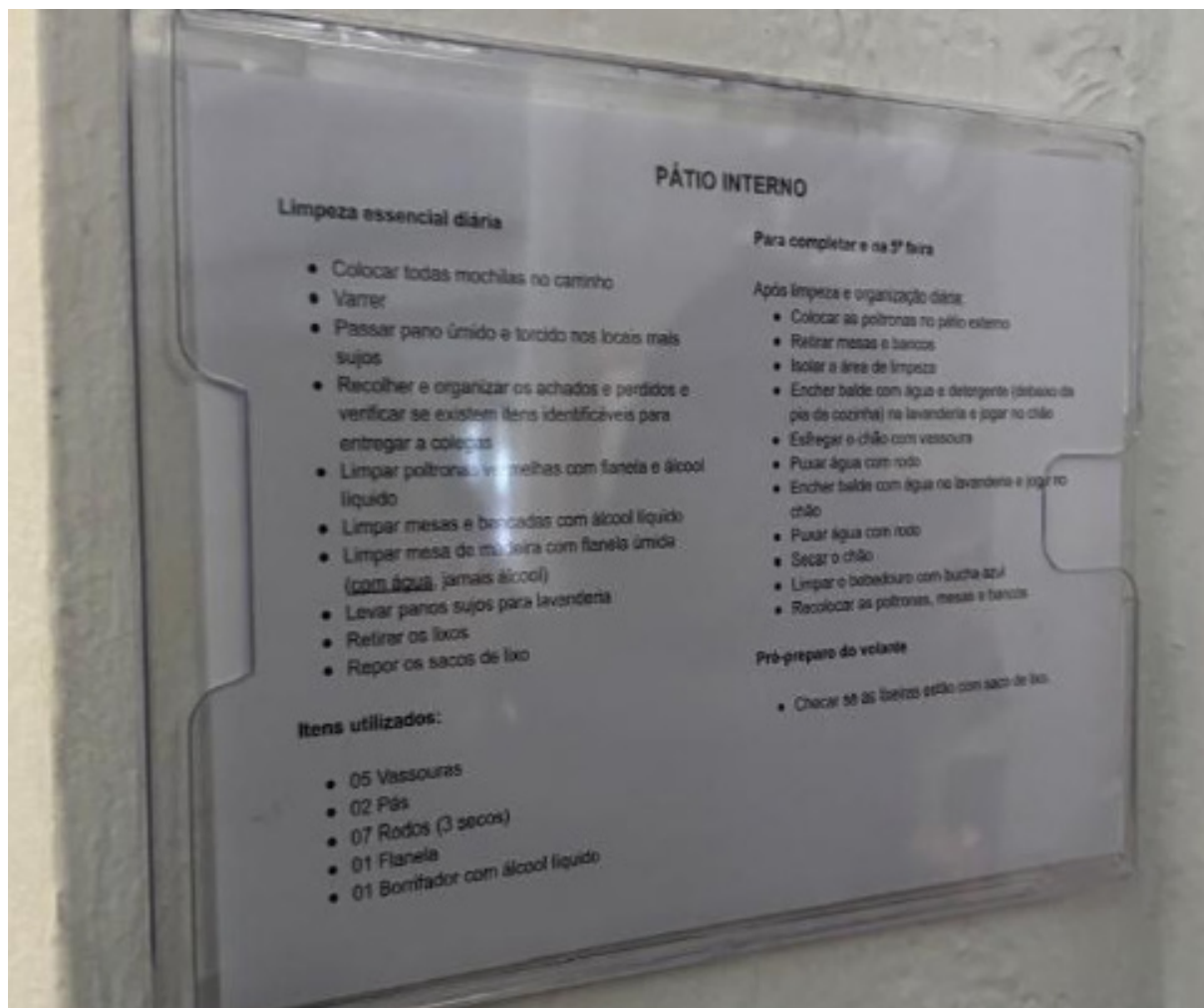
FIGURA 5- Orientações espalhadas pelo pátio sobre a limpeza

rotinas familiares, estimulando maior participação e responsabilidade nas tarefas cotidianas.