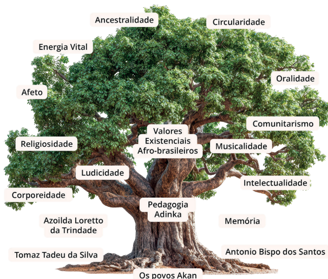
FIGURA 1 BAOBÁ DA PEDAGOGIA ADINKRA

Este é um convite: para educadoras, famílias, instituições e comunidades que ousam imaginar espaços onde a dignidade não seja exceção, mas regra. Onde os símbolos falam, onde a memória orienta, onde a coletividade sustenta. A Pedagogia Adinkra é semente. E como toda semente africana, ela carrega dentro de si o poder de transformar o mundo.